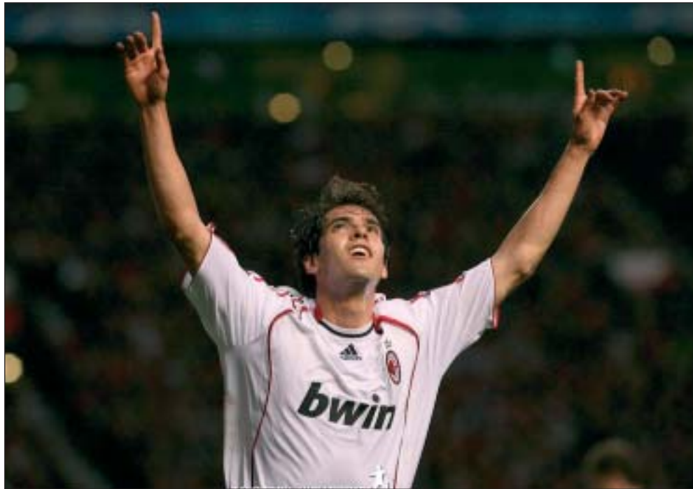
Oso garestiak eta ezagunak izan dira Real Madrilek egindako azken fitxaketak: Cristiano Ronaldo eta Ricardo Kaká. Nola da posible 562,78 milioi euroko zorra duen taldeak halako fitxaketak egin izana? Agintari instituzionalen onespena dago atzean.

CRISTIANO RONALDO, Kaká eta beste batzuen eskandaluzko fitxaketa ikaragarri garestiek agerian utzi dute Espainiako Estatuan futbolaren industriak daukan negozioa. Industria horrek milaka milioi euro mugitzen ditu, baina oinarri faltsuen babesarekin: diru publikoa, babes politiko publiko susmagarri samarrekin egiten diren lursailen birkalifikazioak, eta klubek administrazio publikoekin zor handiak pilatu arren administrazioek klubak kudeaketa kontrolatzeko ahalegin eza. Hala, Espainiako futbol profesionala kinka larrian dago gaur egun.