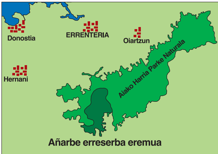
Mapa honetan ikus daitezke Añarbeko basoaren kokapena Aiako Harria Parke Naturalaren barruan. Goiko eskuineko argazkian, Añarbeko urtegia; gipuzkoarren erdiak baino gehiagok edaten du bertako ura. Behean ezkerrean, bisoi europarra.