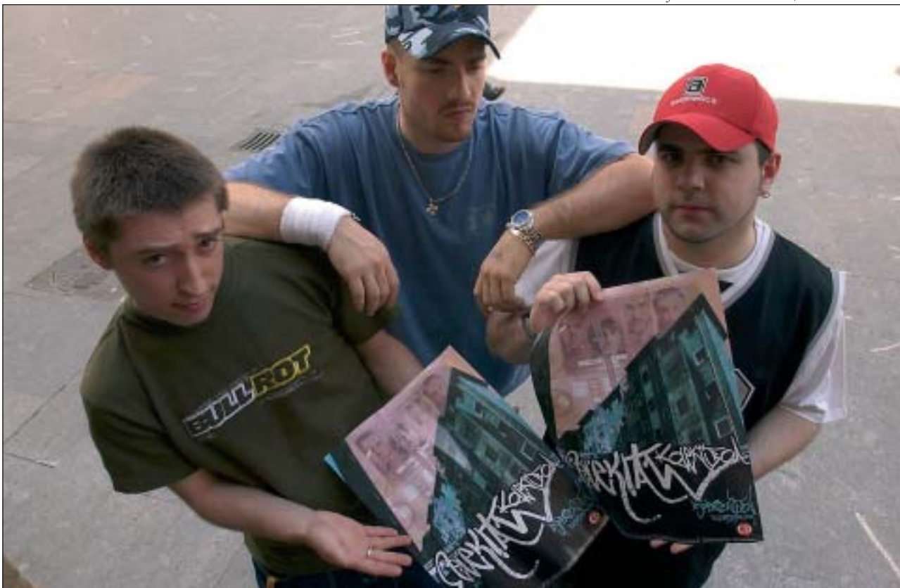
Bidea ireki zuten: Selektah Kolektiboko kideak izan ziren euskaraz rapa egiten aurrenak. Argazkian bigarren diskoa aurkeztu zuten egunean. Esperientzien etorbideetik (Metak, 2002) izan zen atera zuten azken lana. Gero ere jarraitu dute taldeko kideek hip hoparen kultura bultzatzen. Eta lan hori, pixkanaka, ari da fruituak ematen.