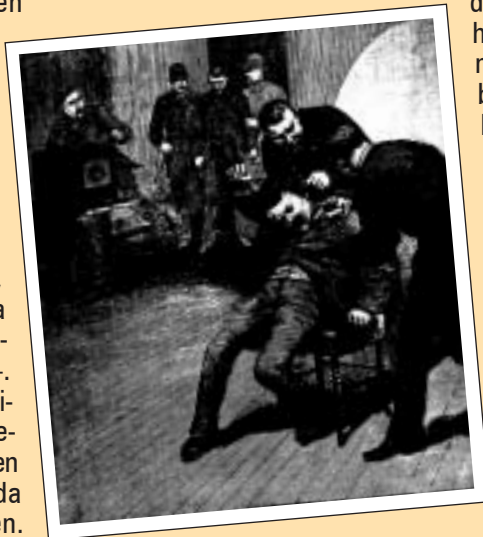
Atxilo anarkista eskua gora duela poliziak erretratua ateratzera behartzen duen unean. Irudi honekin Chicagoko 1886an gertatutakoa azaldu nahi izan zuen La Ilustración egunkariak.

Datorren ostiralean Maiatzaren Lehena ospatuko da mundu osoan. Urteurren honek 1886ko maiatzaren 1ean du jatorria. Egun hartan, Ameriketako Estatu Batuetan greba orokorra burutu zuten zortzi orduko lanaldiaren alde, 18 ordu edo gehiago lan egin ohi baitzuten. Matxinadaren buru Chicago izan zen, etorkin asko jaso zituen hiria —errusiarrek, poloniarrek, irlandarrak, alemanak, frantziarrak...—. Poliziak gogor zapaldu zuten mobilizazioa, grebalari asko tiroz hiltzeraino. Kaos betean, ustez poliziaren aurka jaurtitako bonbak eztanda egin zuten eta polizia bat hil zen. “Haymarket-eko atentatua” deritzon gertaera horren ondorioz, sei langile atxilotu eta epaitu zituzten, baina ez zuten inoiz frogatu errudun zirenik. Sei langileei “Chicagoko martiriak” izena eman zitzaion. Sei langileak urkamen-