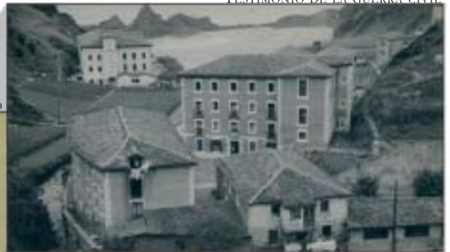
LES PRESONS DE FRANCO