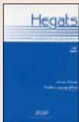
Hegats Batzen artean EUSKAL IDAZLEEN ELKARTEA 174 orrialde