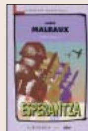
Esperantz André Malraux ALBERDANIA, ELKAR 632 orrialde 23 euro