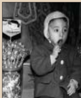
Ezkerrean: gaur egungo Chupa Chupsek Salvador Dalí diseinatutako logoa daramate oraindik. Goian haur bat Chupa Chupsa jaten 60ko hamarkadan.