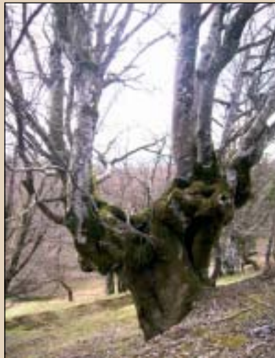
Goian, pago mugarrotua Beundera bidean. Ezkerrean, arbol tantaia atsedenekuan.

Aizkorriko artzaintza, irudi bukolikotik haratago, hamaika familiaren ogibidea da oraindik. Gipuzkoako eta Arabako Partzonerian 8.000 ardi ibiltzen dira; gutxi dira, baina, uda sasoiaren pasatzen duten artzainak, Urbiako zelaietan