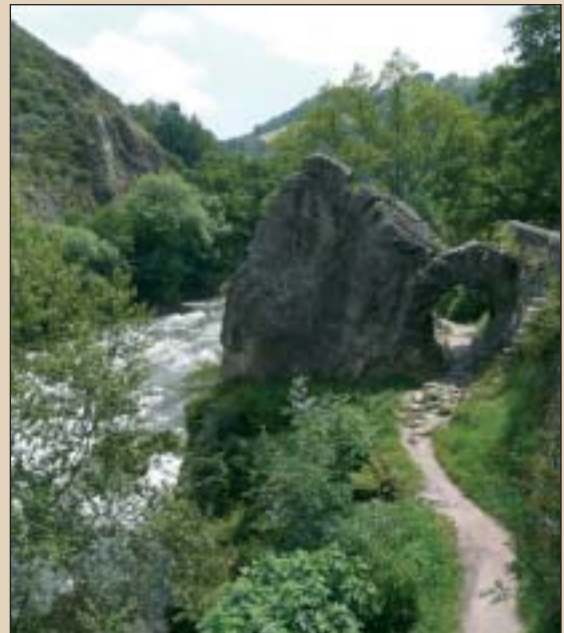
Mondarraineko gailurrera bidean goiko irudikoa bezalako pagadi ederrak zeharka daitezke. Lerroon gainean, Errolanen atea, edo Atekagaiz. Kondairak dio Karломagnok berak egin zuela zuloa, ezpata kolpe batez. Baina ez zen Karломagno izan, Laxiako laborariak baizik.

saihestuz iristerik izango genuke, hala nahi izanez gero. Bidarraireta Ainhoa artekoa osatzen du GR-10-ak inguruotan. Iguzkimendik (844 m) ikuspegi ederraz eskertuko digu, ordea, arnasa estutu izana. Gailurrean norabidea mendebalderantz okertu eta xenda argiegirik gabeko aldapa gogor batean behera egingo dugu, ostera GR-10 ibilbidearekin bat egin arte. Artzamendiko gailurreria utzita Mondarrainekoan sartzen ari gara, ibilbide zirkularren eratzuna ixteko ahaleginan.