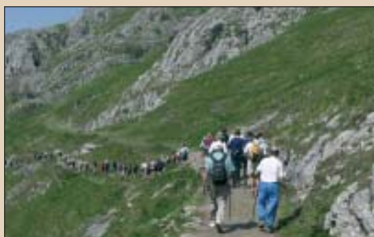
Goitik behera: 1) Guardetxetik Igaratzara doan bidean; 2) Igaratzen; 3) Arritzagako amildegian behera, Amezketara bidean.

nik gabe, hanketan kilometroak pila-tzen goazela sumatuko dugu.