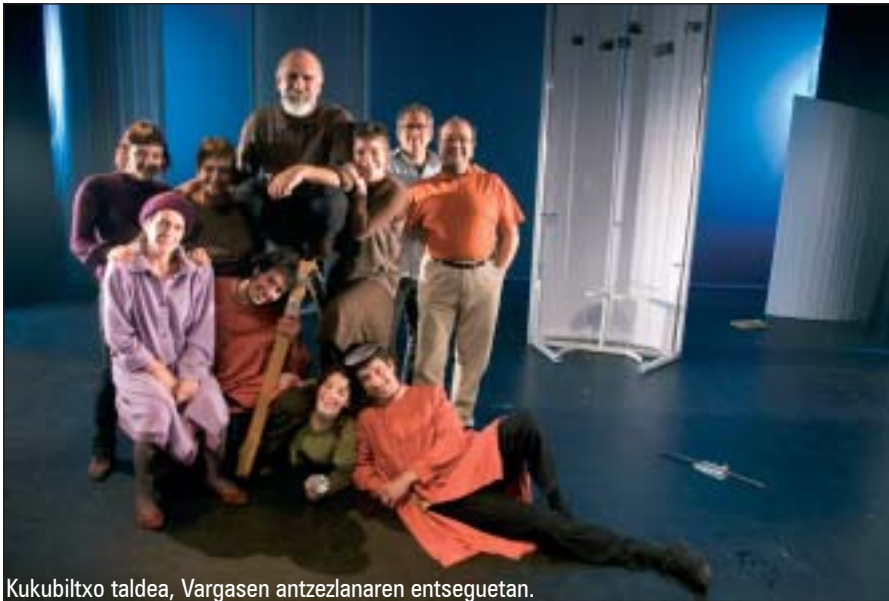
Kukubiltxo taldea, Vargasen antzezanaren entsequetan.