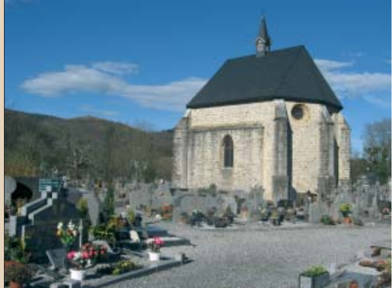
Ezkerrean, Lextarreko plaza, Udaletxetik ikusita. Eskuinean, Berrauteko kapera. Ustez, han daude lurperatuta Matalazén gorpuzkinak.

Xuria. Historia ikertzaileek diotenez, kurutze honi eskegi zioten Matalazén burua, zuberotar borrokalarien aitzindari jarritakoa 1661eko azaroaren 8an, Frantziako esku-makilek hil eta gero. Historiak dioenez beti ere, zuberotarrek berehalaxe berreskuratu zuten Matalazén burua eta ustea bada gaineratiko beste gorpuzkinekin batera Berrauteko elizatxoaren aldarepean ehortzia izan zela.