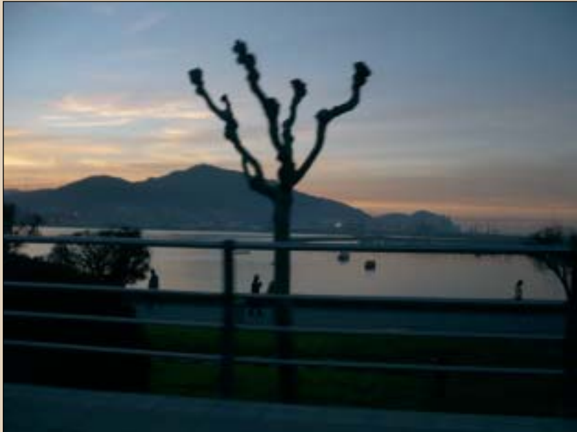
Ezkerreko argazkian, Serantes mendia Getxotik ikusita. Ezkerraldekoentzat ez ezik, Uribe Kostako biztanle askorentzat ere eguneroko paisaiaren ezinbesteko zati bihurtu da Serantes. Eskuman, Abra eta Galea lurmuturra, Getxon.