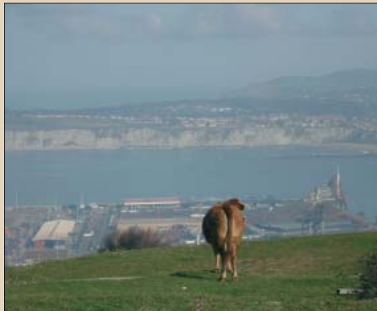
Ezkerrean, gotorlekuaren hondarrak. Santurtziko portua behatzeko leku egokia izanik, hainbat eraikin militar egin izan dira Serantes mendian. Eskuman, behia Abrari begira. Superportua ageri da lehen planoan, Getxoko labar ikusgarriak itsasadarraz bestaldean.

Aurrez ditugunak aldapa luzeenak dira gainera, baina esfortzu apur batekin berehala helduko gara behinola funtzio militarra izan zueneko gotorlekura. Bista ederra dago handik, bai alde batera, Meatzaldera, zein bestera, Abrara eta itsasadarrera.