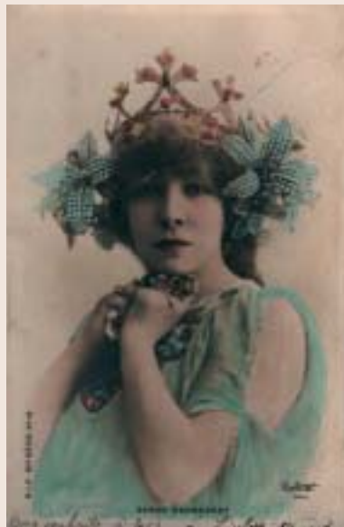
Sarah Bernhardt-en argazki koloreztatua.

Photomuseum, Zarauzko Argazki eta Zinema Museoa, altxor kutxa bihurtu da. Erretratu izeneko erakusketa ikusi besterik ez dago museoak eskuratu duen bildumaren garrantziaz jabetzeko. XIX. mendeko eta XX. mende hasierako argazki-bilduma ederra jaso du Photomuseumek Gipuzkoa Donostia Kutxaren eskutik. Delgaray familiak osatutakoa da eta milioika euroko balioa du. Guztira, berrehun argazki baino gehiagok osatzen dute bilduma osoa, baina, hasteko, horren zati batekin osatu dute lehenengo erakusketa hau.