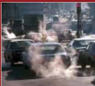
Autoen keak bihotzeko arazoekin du lotura.

Iruñea, Bilbo,artzelona, Cartagena, Castelló, Gijón, Granada, Huelva, Madril, Oviedo, Sevilla, Valentzia, Vigo eta Zaragozan hartutako erregistroekin hainbat gauza argitu ahal izan dira. Arazo nagusia erregai fosiletan omen