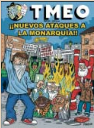
Goian TMEO aldizkariaren 0. zenbakia. Behean berriz, 96. zenbakia, argitaratu den azkena.

badaude estilo landuagoa dagiten autoreak TMEOn : Piñata eta Furillo kasu. Ez ditugu egileak estilo zehatz bat erabiltzera behartzen.