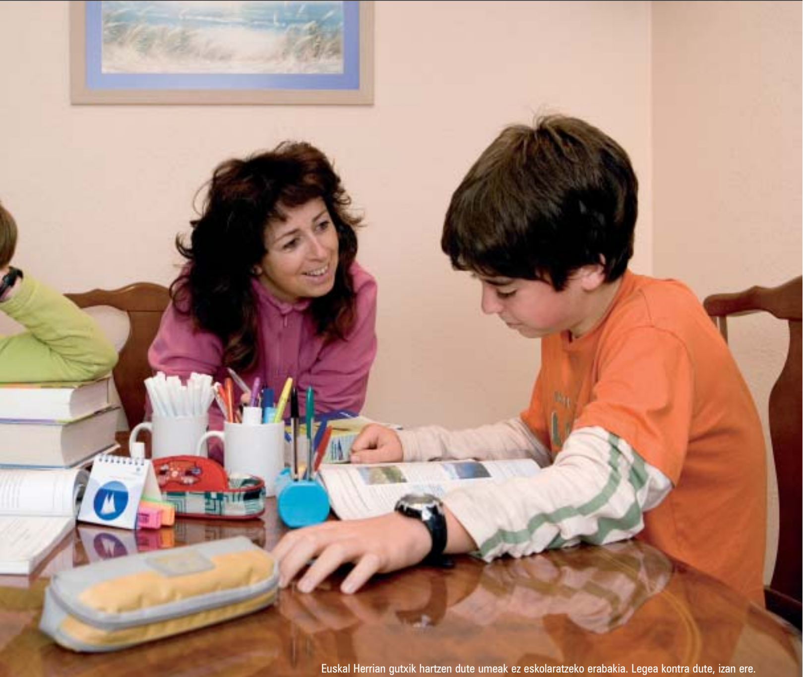
Euskal Herrian gutxi hartzen dute umeak ez eskolaratzeko erabakia. Legea kontra dute, izan ere.