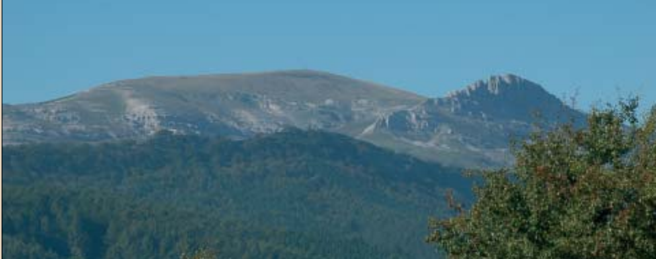
Gorbeia ren gailurrean ozta-ozta ikusten da gurutze ospetsua. Eskuman, Aldamin mendia.

batera salto egin guran, urteen indarrei eta gizakiaren jardueri aurre egitea lortu duen pago izugarria gailentzen da; paraje sinplea dirudien arren, gozamen handia sortarazten digun horietakoa.