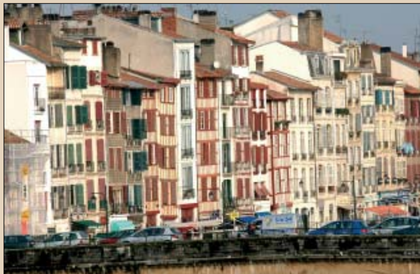
Hiri bizia da Baiona. Argazkian, Génie zubia.