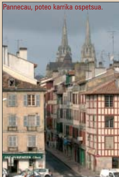
Pannecau, poteo karrika ospetsua.

“Nahikoa, kito” izan da jaten hasi eta esan duguna. Esan genezakeen Pirinioen oinetan dagoen 44.300 biztanleko hiria dela Baiona. Esan genezakeen Angelu eta Biarritzekin batera BAB hirigune jendetsua osatzen duela. Esan genezakeen hiri txikitik baino gehiago duela herri handitik. Esan genezakeen