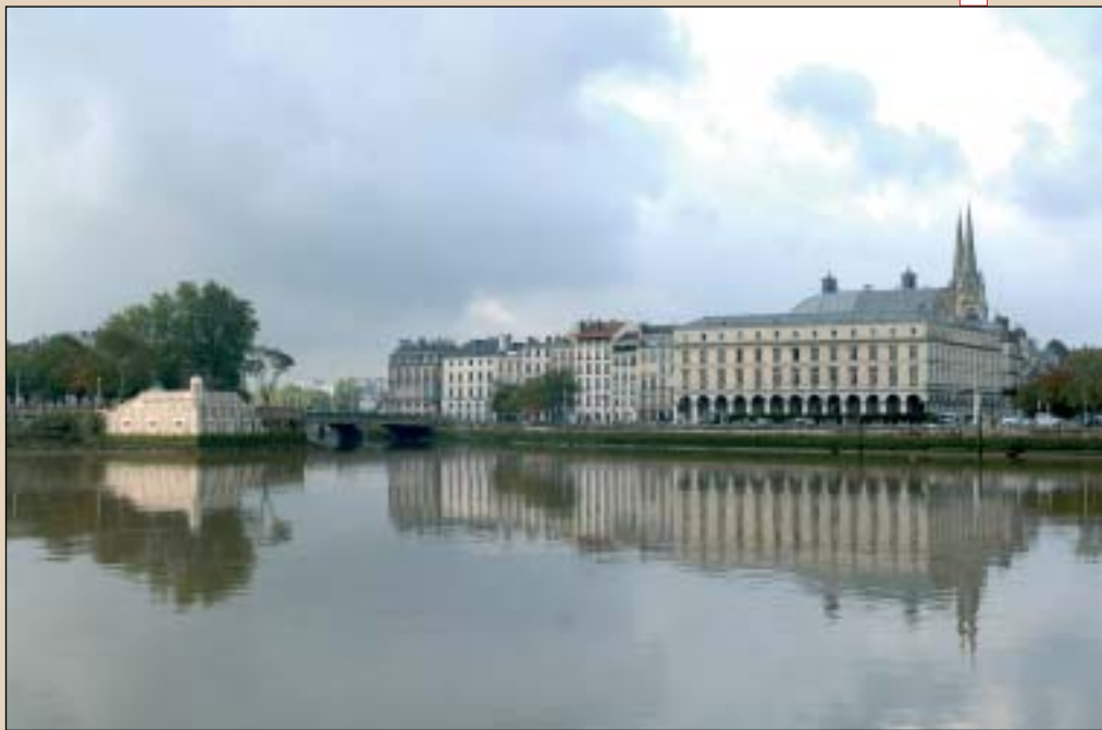
Goian, Herriko Etxea eta antzokia, Aturri ibaiko uretan islatuta. Eskuinean, gaztelu zaharra.

Bonnat museoak ere izanari zor dio izena. III. Errepublikako lehendakariaren portretista ofiziala zen Leon Bonnat Baionako semea. Bere obrek fama baino diru gehiago eman zitoten arren, 400 pintura, 1800 marrazki, eta 600 eskulturako kolekzioa osatu zuen handik eta hemendik, herriari egindako emaitza propio eraikitako museoare-