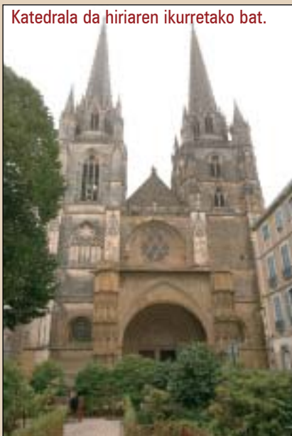
Katedrala da hiriaren ikurretako bat.