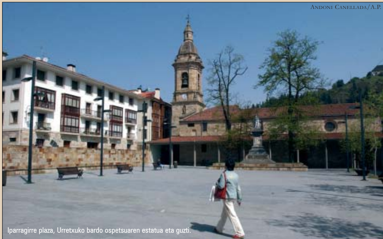
Iparragirre plaza, Urretxuko bardo ospetsuaren estatua eta guzti.