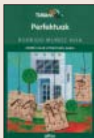
Perfektuak Rodrigo Muñoz Avia GILTZA 202 orrialde 7,35 euro