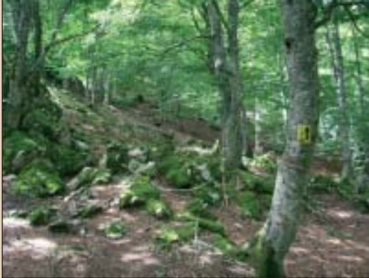
Oltzatik Urbiara doan bide ederra, pagadian.