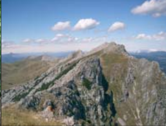
Aitzabal, Aketegi, Aitxuri eta Arbelaitz, Aizkorriko gailurretik.