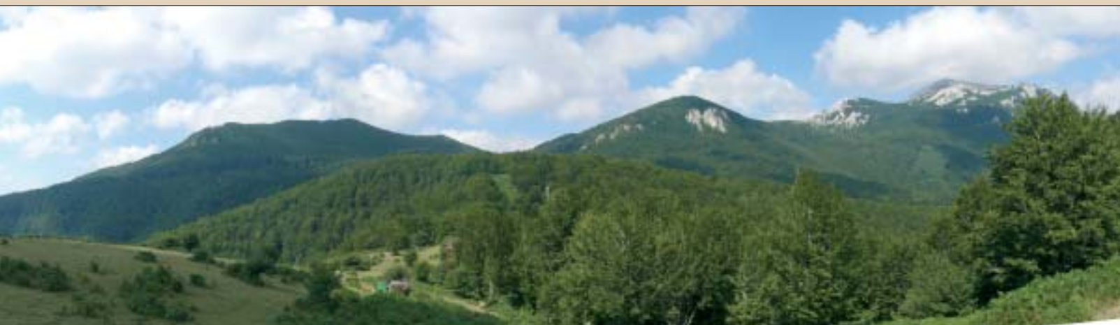
Umandia, Allarte, Imeleku eta Aratz, Atabarratera bidean.

Zegama hurbil dugu dagoeneko, eta ibilaldiko hondarreko kilometro gehienak maldan behera dira. Itzu-