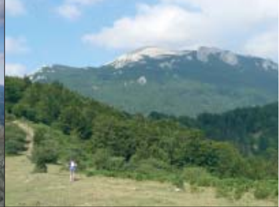
Lasterkaria Atabarrateko bidean. Atzean Aratz.