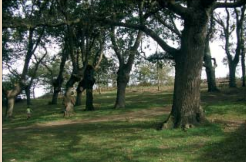
Goiko argazkian Jatako tontorrera heltzeko azken aldapa: kilometro eskasean ia 350 metroko desnibela gainditu behar da. Eskuineko erretratuan Zumetxagako hariztia, leku aparta kera egin eta mokadutxoa jateko.

Hala, berriz edukiko dugu Jata ikusteko aukera, eukaliptadi txiki bat zeharkatu eta gero. Oraingoan, baina, askoz hurbilago ikusiko dugu gure ibilaldia- ren helmuga, eta ez lehenago bezala gure eskuma aldean, ezkerrean baizik.