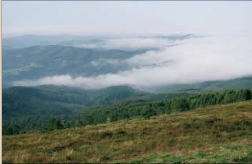
Gailur-gailurrean Espainiako Geografia Institutu Nazionalak jarritako erpin geodesikoa dago.