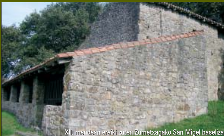
XII. mendean eraiki zuten Zumetxagako San Migel baseliza

MUNGIAKO UDALEKO ordezkari batek esan digunez, inguruko biztanleek -Larraurikoez eta Bakiokoez batez ere- betidanik eduki dute San Migel egunean Zumetxagara igotzeko ohitura. Orain dela sei edo zazpi urte nolabaiteko ofizialtasuna eman zitzaion usadio horri, eta hala, irailaren 29an,