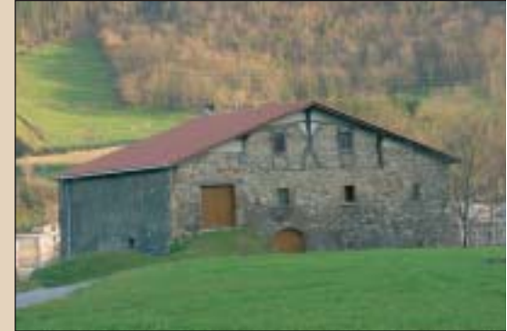
Ateaga baserria, goian; Sarobe eta Tapia, eskuinean.