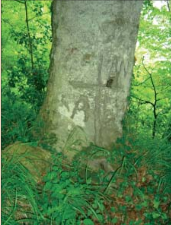
Mugarriaren ondoko pago batek mugakide diren hiru herrien inizialak ditu marraztuak: Anoeta (AN), Alkiza (A) eta Hernialde (E).

bertan PR-Gi 127 ibilbideko markei jarraituz Agirre Txiki bordarako eta Agirreko karobirako bidea hartuko dugu. Bide honi jarraituz Anoetako Elbarrena bailarara helduko gara, eta Sarobe, Agirre, Etxeberria eta Tapia baserriak ikuskatu ahalgo ditugu besteak beste. Tapia baserrian gaudela, trenbidearen gaineko zubia igaro ostean ezkerretara hartuko dugu. Kasu honetan Santiago bidea seinaleztatzen duen gezi horiak jarraituko ditugu Anoetara iristeko. Trenbidearen azpiko bigarren tunela zeharkatzean ezkerretara doan bidexka har-