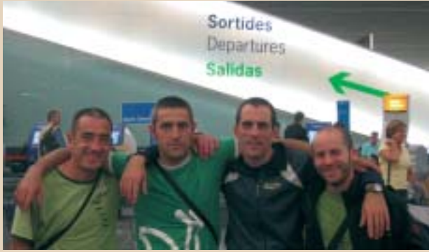
Egilea, ezkerretik bigarrena, Bartzelonako aireportuan.