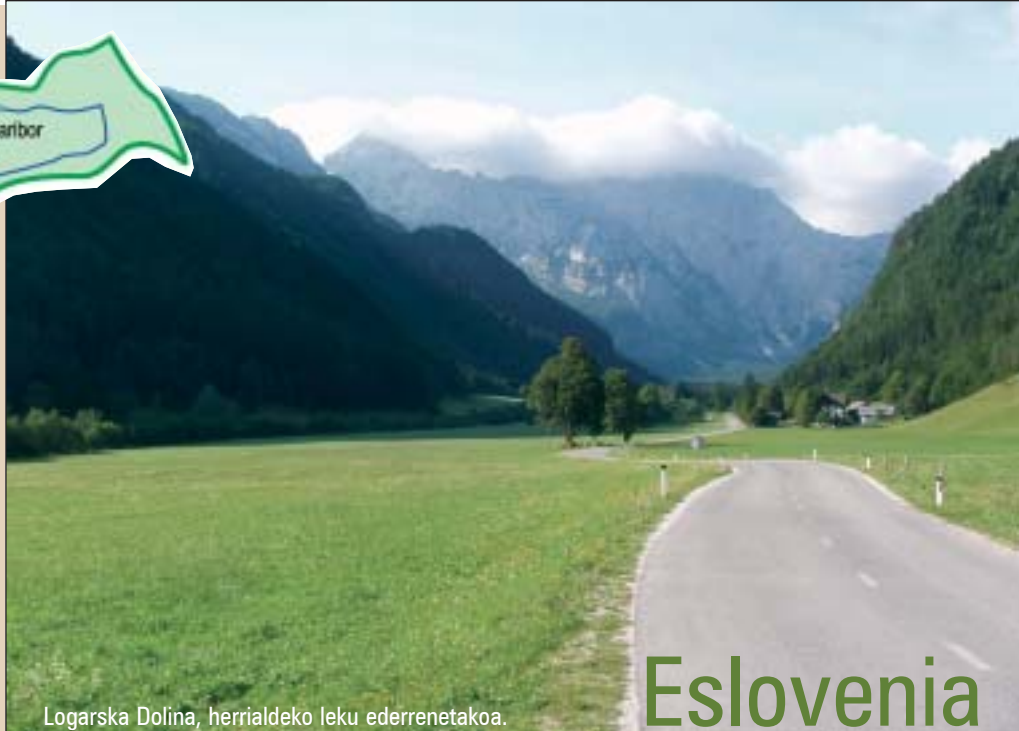
Logarska Dolina, herrialdeko leku ederrenetakoa.