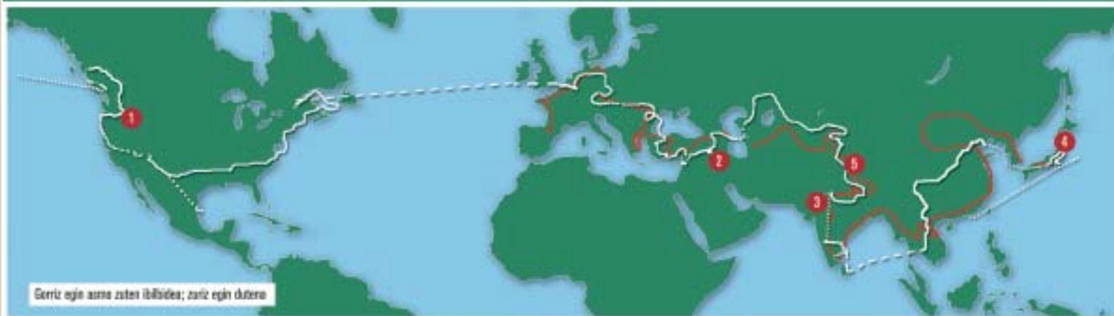
Serriz egin azma zuten ibilbidea; zuriz egin dutea