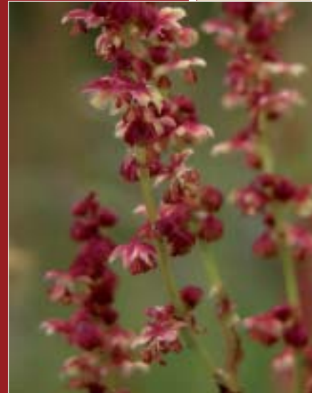
Rumex acetosella , euskaraz uztao txikia du izenetako bat.

Berari begira ni sentitzen naiz, ordea madarikatu. Rumex genero honetako ahaideek geurean dituzten izenen emanak eta horiek jasotzerakoan eraiki den nahaste-borrasteak ia nobedearaino burzorutzen nau. Hara: Rumex angiocarpus , R. acetosella , R. friesii , R. hydrolapathum , R. patientia , R. tingitanus , R. scutatus , R. amplexicaulis , R. acetosa , R. intermedius , R. crispus , R. conglomeratus , R. sanguineus , R. pulcher , R. obtusifolius , R. bucephalophorus eta Rumex x pratensis behintzat inoiz geure florakotzat jaso izan dira. Dagozkie euskarazko izenak jasotzerakoan dator zurrumbiloo: aipatutako mineta, mingotsa, goxoa, belar-gazia, eta gazigarratza gain andere-belarra, ahagoa, ahagorria, zioblaxa, ziolatxa, ziorlatz eta ziorlatxa, atxitabla, andragarratza, lapaza eta lapaitza, lapazuala, gazi-gaxa, uztaoa, uztao handia, uztao txikia, gazigoxia, laxebelarra, mingarratz txiki eta handi, martxinbedarra, martxingarratza, martxingarra, martxinladarra, pintxagar, ozpin-belarra, ozpiñontzi, plantana, txarragitarra, txingarres, txintxagar, atxitabla, barrengorri, espimendarri, tximingorri, txirritabla, armixola, garramixola... Zorabiotik neure oneratu ondoren, zikulu-saltsa hau nor argitu zain naizen artean genero honen lore batzuk bildu eta mahai gaina gorri jartzera noa.