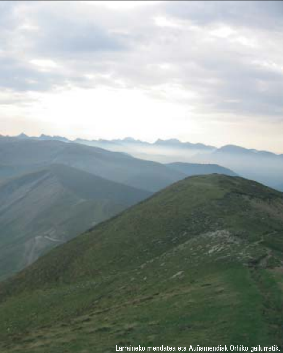
Larraineko mendatea eta Auñamendiak Orhiko gailurretik.

markatutako norantza jarraituz Euskal Herriko txoko liluragarri- netako batera iritsiko gara, mendi bide zabal bat hiru kilometroz