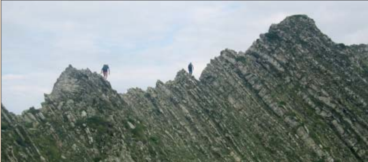
Zazpigañara bidean, Alupiñako gandar aereoan.