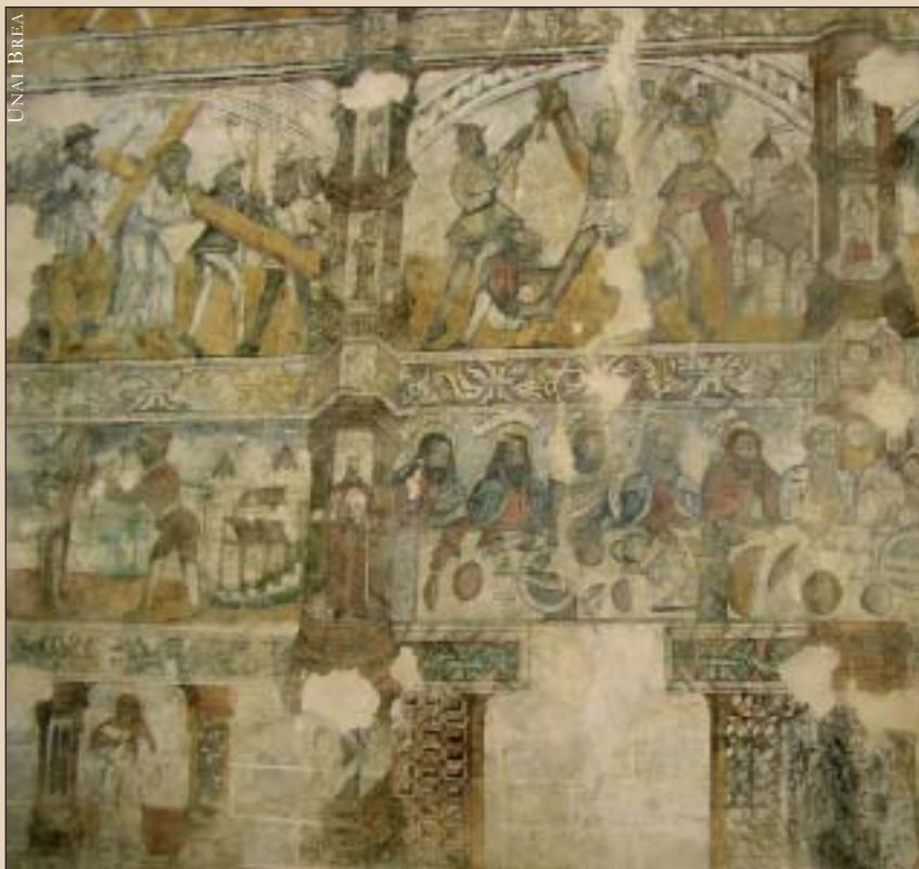
1989an deskubritu zituzten polikromia eder hauek Biañezko elizan; 92 metro koadro artelan guztira.

ten du Karrantzaren ekialdeko muga. El Sucesoko amabirjinaren omenezko santutegia dago bertan, eta hari itsatsita, siamdar bikiak bailiran, zezen plaza zaharra. Santutegia XVII. mendean eraiki zuten, eta mende bat geroagokoa da bere barruko erretaula barroko ikusgarria.