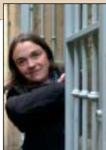
IMANOL OTEGI / A.P.

Tradizioa baino arkaikotasuna dei nezake nik Beste eguzkian sakontzen saiatu naizena. Horrek erran nahi du gure iragan historikora begiratu behar dugula eta handik hainbat gauza berreskuratut: berdintasuna ematen zigun inguruaren kontzeptua, adibidez, elkartasuna jokamolde naturala egiten zuena. Alegia, iragana idealizatu gabe, iturri zaharretik ura beti berri mantentzen saiatu beharko genukeela.