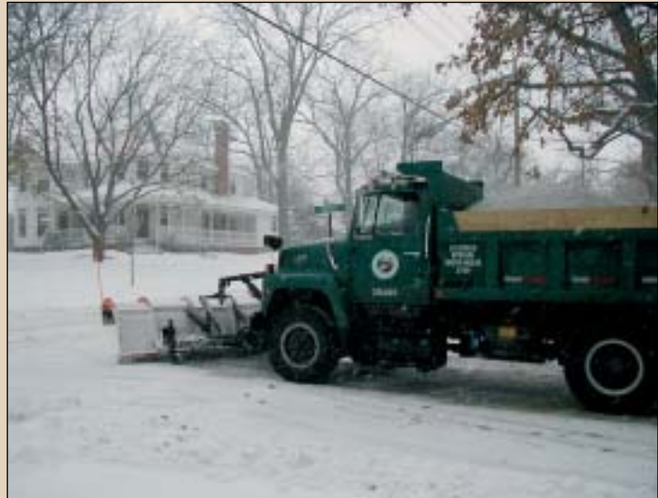
Illinoisko negu giroa ez da epel-epela izaten; lanak ditu sinesten garai batean klima tropikala zela hangoa.

Illinois-eko basoan likofitoak ziren ugarienak eta 40 metroko altuera izatera ailegatu ziren. Egun, berriz, haien seniderik hurbilenak diren likopodoak, adibidez, belarra baino ez dira. I