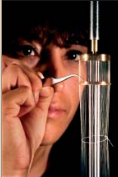
Ura konprimatzean berotu eta gogortu egiten da.

AEBetako Sandia Laborategian Z ize-neko makina bat dute. Makina horretan ura era bortitzean konprimatu zuten behin eta berriz. Ura konprimatzean berotu egiten da, baina konprimaketa oso handia denean ura solidotu (izoztu) egiten da eta bere tenperatura uraren irakite-tenperatura baino handiagoa izatera iristen da.