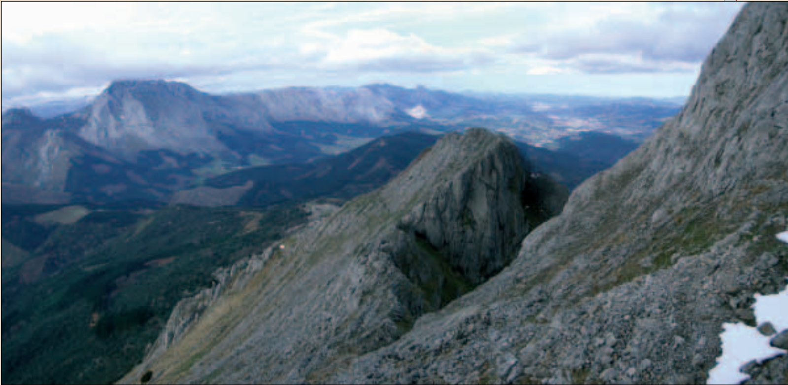
Durungaldeko mendiak eta Durangoko ibarra, Udalatxeko azkeneko maldetatik. Besaideko monumentua ere antzematen da behean.

kartsua. Besaideko monumentu biak bisitatu, atsedeen hartu eta eguneko igoera gogorrena hasten den lekura itzuliko gara.