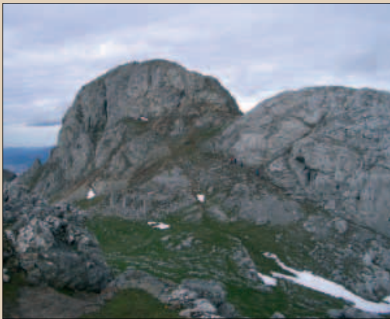
Anboto, elurrez ziprztindua, Udalatxeko kobatik; eskuinean Udalatxeko tontorra eta antzinako ermitategia, gurutzea dagoen talaiatik.

topo, iturri baten alboan. Hemendik oso gertu dagoen Besaideko monumentua bisitatu ondoren, puntu honetara itzuliko gara berriro Udalatxeko maldei aurre egiteko. Udala auzora eraman gaitzakeen bidea egon badagoela jakitea garrantzitsua da, aurrez egindako planak aldatu