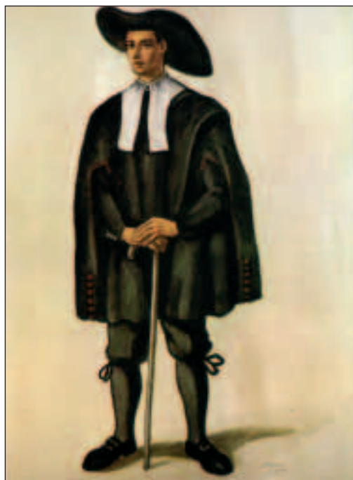
VASCOS Y TRAJES