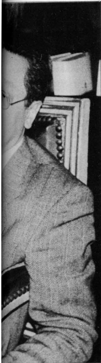
ko jeinu bat, edonola ere