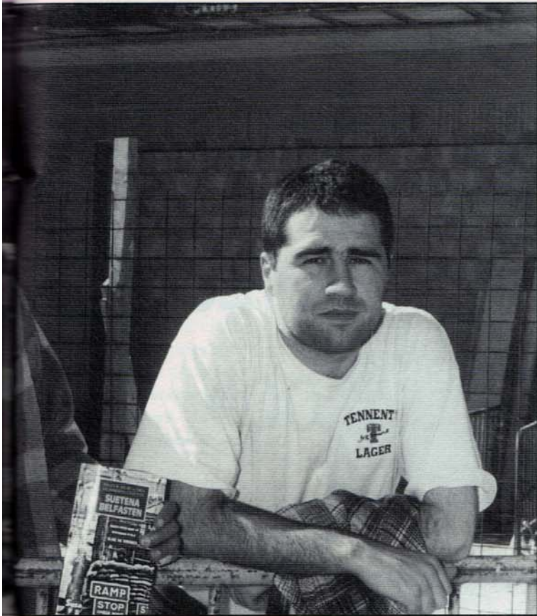
Iazko udaberri eta udan -tregua indarrean- ezagutu eta bizitakoak jaso dituzte «Suetena Belfasten» lanean. (A.: Alberto Elozegi).

gure lanaren oinarria eta lana bera periodistikoak izan da, horixe menperatzen dugulako». Ez da, baina, horretara mugatu. «Errekurtso literario batzuk erabili behar izan dira, eta hein horretan fikzionatu dira parte batzuk».