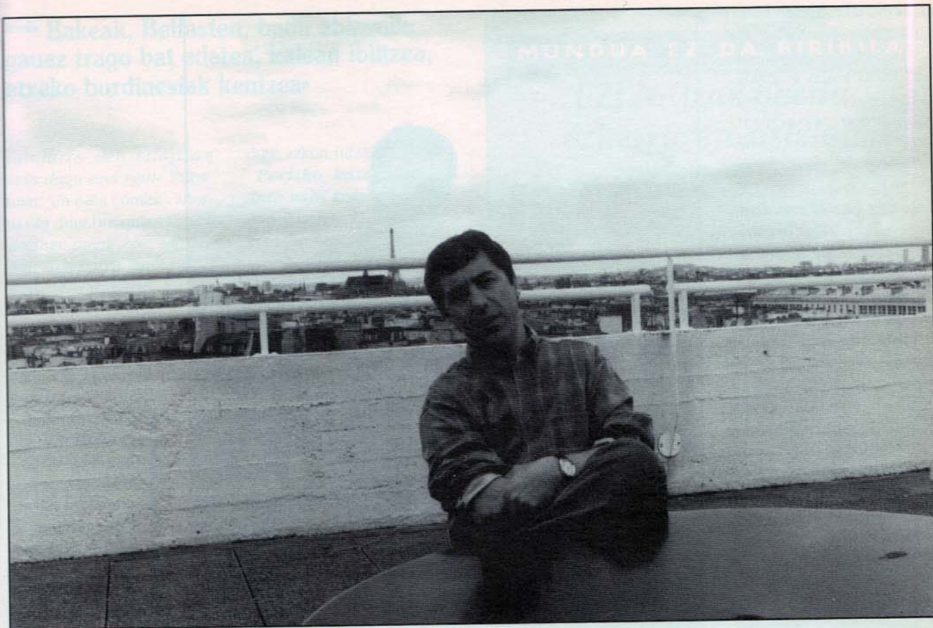
Sorj Chalandonek dioenez, maiatzaren 30eko hauteskundeak protestante-loyalistentzat soilik izan dira mesedegarri. (Arg: J.Arriola).

gehiagorik ezin zezakeen egin. Lehenbiziko aurre-bal-dintzari, su-eten iraunkor eskariari, ezetz erantzun zion IRAk. Hilabeteko epea eman zioten horretarako. Bigarrenagoan, hiru hilabete itxaron behar zutela zioten britainiarrek, su-etena benetakoa zela frogatzeko. Hirugarrenagoan, armak entregatzeko agindu zioten IRARI.