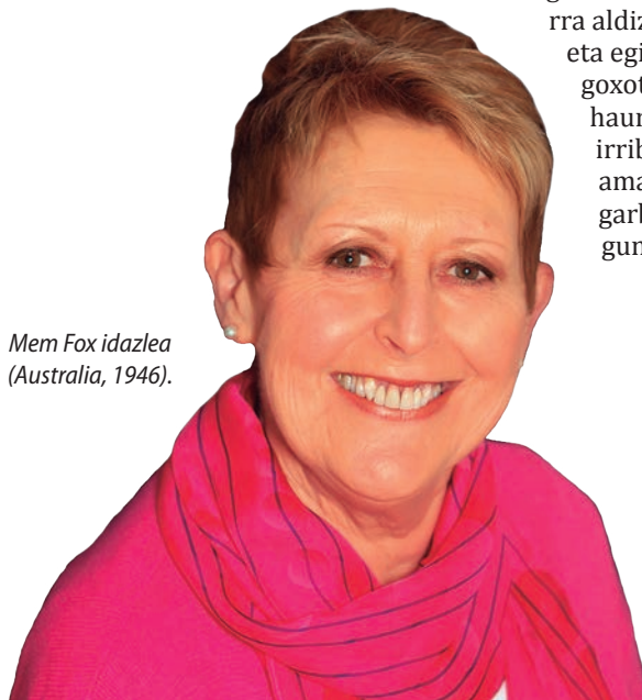
Mem Fox idazlea (Australia, 1946).

Horixe da liburu honen ideia nagusia. Liburu honen indarra aldiz, ideia horretan eta egileek lortu duten goxotasunean dago... haur protagonisten irribarreetan eta amaieran argi eta garbi erakusten zai-gun goxotasunean. ■