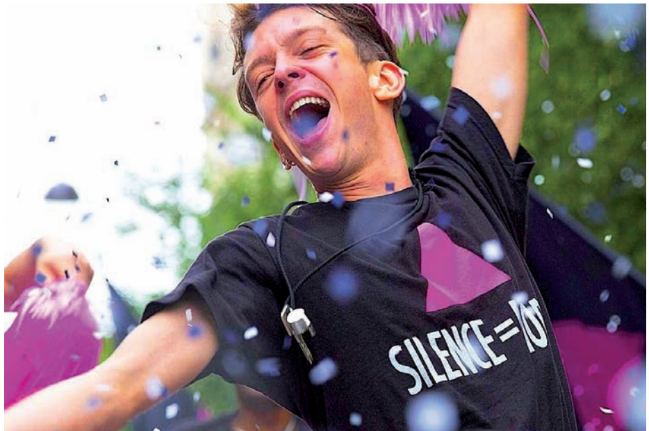
Argazkia '120 battements par minute' filmeko fotograma da. Filma 90eko hamarkadan hiesaren aurka borrokatzeko sortutako Act Up mugimenduaz da. Frantziak Oscarretara aurkezteko aukeratu du.

Hastapen batean botere erraldoi horiei atakatzearen ideiak berak iltzatzen gintuen, baina laster ohartu ginen atsegingarri ere izan zitekeela. Plazera ere bazen. Gure txikitutasunaren parean hain ziren jomuga erraldoiak non eta nahi