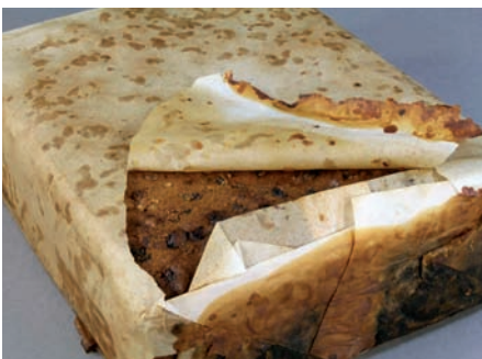
ANTARCTIC HERITAGE TRUST

293an Konstanziok Karausioaren tropak menperatu zituen Galian. Beste hiru urte beharko zituzten Britainiar uharteak berreskuratuz, baina Karausio 293an bertan hil zuen Alekto adiskideak. Heriotzean ez zuen Erromatik bereiztea lortu, lagunak laguna hiltzea erromatar "tradizioa" baitzen. ■