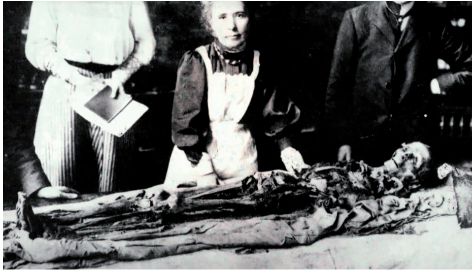
Margaret Murray egiptologoa, momiarri bendak kentzeko prozesua azaltzen 500 ikusleren aurrean, Manchesterren, 1908an.

Antzinaroan, substantzia organikoen nahasketa beltza lortzeko iturri bakarra zuten: Itsaso Hilaren inguruko biltegi naturalak. Baina Egiptoko momia zaharrak aurkitu zituztenean substantzia beltz likatsuz estalita zeudela konturatu ziren, erretxinak denboraz belztu egiten baitziren. Ustez, sendagai mirakulutsuaren iturri alternatiboa topatu zuten. XII. mendetik aurrera, substantziaren izen persiarra gorpu osoa izendatzeko erabiltzen hasi zen, eta betunaren ahalmenak ere momia osoari egotzi zizkioten. Sinesmen horri merkatarien marketina gehituta, Erdi Aroan momiak salgai gutiziatu bihurtu ziren. Milaka momia eraman zituzten Europara, han birrindu eta hauts moduan saltzeko. Hauts hartzen zuenak momien botere misteriozua lortuko zuten.