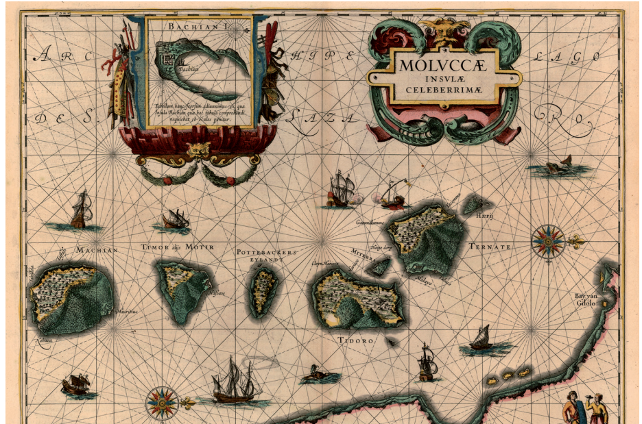
WILLEM JANSZON BLAEU