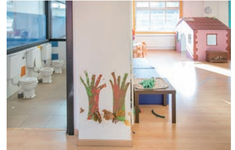
Argazkiotan, Arizmendi ikastola. Goiko irudian, Lehen Hezkuntzako gunea. Behean, ezker-eskuin: 0-2 urtekoen eremuan dagoen aldapatxoa igotzen duen umea prest dago espazio berri eta konplexuagora jauzi egiteko; testuinguru eta txoko ugari eskaintzen zaizkio ikasleari; komunak, mistoak eta beiratez inguratuak: "Ez dugu ezer ezkutatzeko".

espazioaren kontzeptua ezin da isolatu planteamendu pedagogikotik, "eta eskolako espazioek, salbuespenak salbuespen, gizarte eredu bati erantzun diote, industrializazio garaiko mentalitateari: diziiplina eta autoritatea. Horrek eskatzen du irakaslea erdigunean eta ikasleak ilaratan jartzea, irakasleari entzutea eta obeditzea helburu, norabide bakarreko irakaskuntza baten barruan. Egungo gure planteamenduan, irakasleak ikasleei informazioa emateko momentuak ez dira desagertzen, baina kontua da zein proportziotan egiten den hori, eta nola: taldeka aritu daitezke ikasleak, talde batean eurak autonomo, eta beste talde batean irakaslea lagun dutela. Norabide askotan eraikitzen baita ikaskuntza prozesua, ez irakaslearengandik bakarrik". Hori guztia errazten eta ahalbidetzen du espazioa birmoldatzeak. "Gainera, orain arteko espazioak hotzak ziren, beste goxotasun bat bilatzen ari gara".