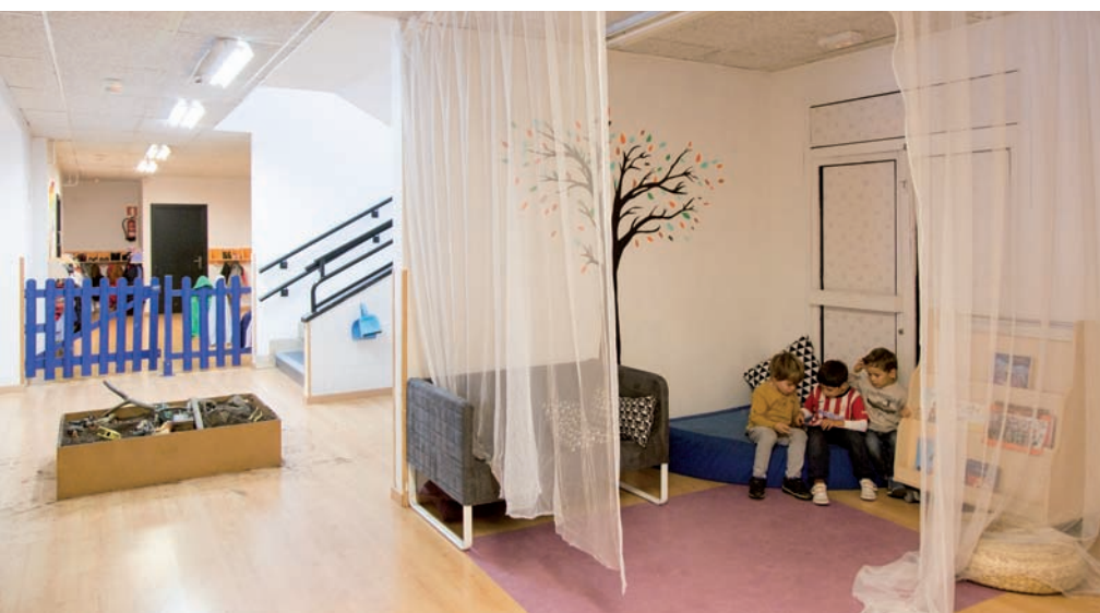
Paretarik gabeko eremu irekiak, ludikoak eta koloretsuak aurkitu ditugu Arizmendi ikastolako Uribarri eraikinean (Arrasate): txokoka antolatutako espazioak, lasai egoteko gunea, zailtasun maila ezberdineko azpiegiturak, intimitaterako zuloak nonahi...