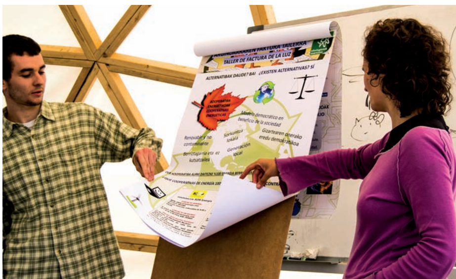
Argindarraren faktura interpretatzeko tailerra, iaizo urrian Bilbon egindako Alternatiben Herrian.