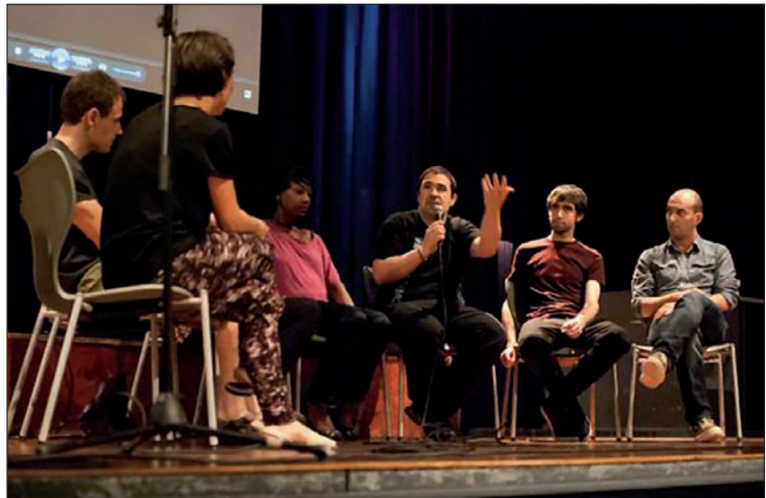
Egun, hamabost dira eraikina erabiltzen ari diren taldeak (Sare, Gurutze Gorria, Trikitxaranga edota Oñatiko Bertso Eskola, esaterako), eta partaide gehiagoren presentzia aurreikusten da etorkizunean.

Bitartean, bilkurek ez dute etenik. Proiektuko kide direnek lanean dihardute, funtzionamendua zehazteko ahaleginean. Oinarriak finkatuta daude jada. Elkarlana da fun-