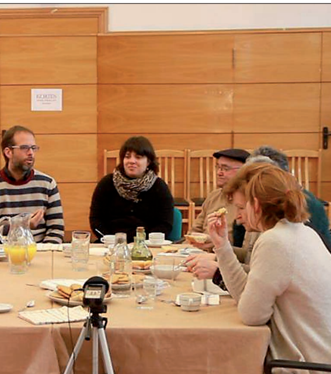
ORIOKO CURRICULUMA SORTZEN