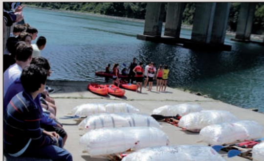
Aurten bigarren aldiz egingo dute Erronka lehiaketa eta finala uretan izango da.

Hori izan da, hain zuzen ere, aurtengo jaiaren helburuetako bat: urriaren 5ean jendea herrian hartzeaz gain Orioren nortasuna herriko mugez harago eramatea. Eta horrek isla izango du egunean bertan ere, Herri Ikastolako guneko eskaintza osoa herriko eragileek sortua izango delako.