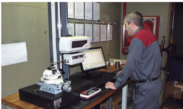
Heroslam laminazio-erreminta enpresa, Espainiako Estatuan aktiboan urte gehien daraman SALa da.

zioa bai egon da. Zer eragin dauka SAL bat izateak nazioartera esportatzeko? “Bezeroak lehenengo momentuan behintzat ez du baloratu ere egiten, produktua, zerbitzua eta prezioa begiratzen ditu”. Ostera, konfiantza giroan, bezeroak estimatzen du langileen prestutasuna urgentziei erantzuteko: “Bisitan etorri eta ikusten dute kontseilu errektoreko presidentea tailerreko makinan lanean; harrituta geratzen dira eta oso positibotzat dute”.