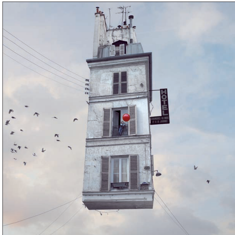
Ezkerrean, Les Grandes Vacances , Bernard Faucon. Eskuinean, Flying Houses , Laurent Chehere.

normalean herriko aisialdirako espazioak aukeratzen dituzte. Ereagako hondartza, oinezkoen Basagoiti kalea, San Nikolas plaza edota Algortako Portu Zaharra antzaldatu egiten dira argazki hauen erakustoki bilakaturata. “Espazio publiko horien bestelako erabilpena aldarrikatzen dugu”, diosku Azpuruk.