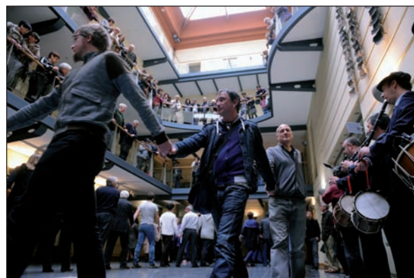
FELIX MORQUECHO-CC BY SA