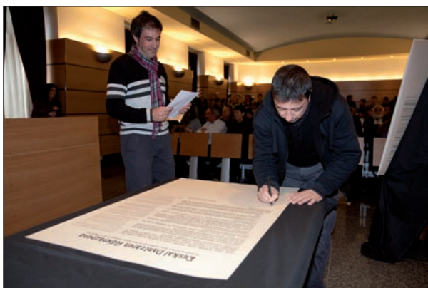
FELIPE LOYOLA-CC BY SA