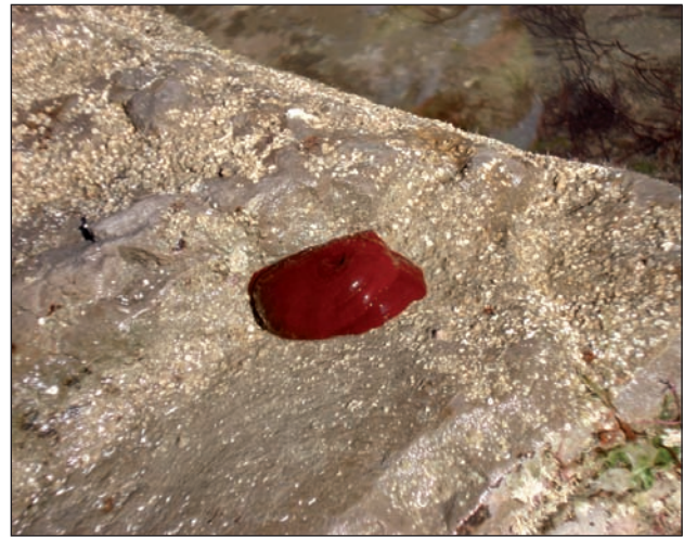
Aktinia gorria, itsas tomatea, Actinia equina .