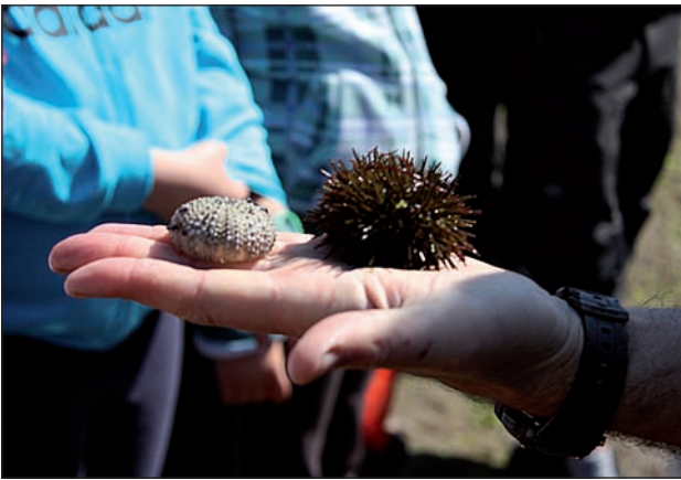
Itsas triku arrunta, ostarrena Zumaian, itsas lakatza Itziartik Mutrikura, Paracentrotus lividus .