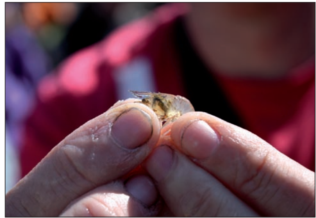
Izkira, Palaemon elegans .