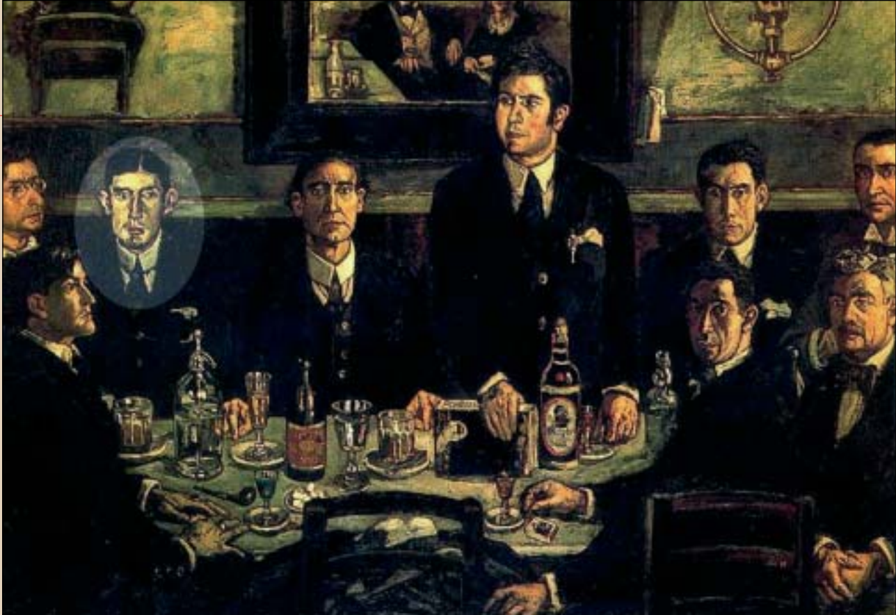
Gutierrez Solanaren La tertulia del café de Pombo margo ezaguna (Reina Sofia museoa, Madril). José Bergamín gazte eta lotsati azaltzen zaigu bertan. Idazle madrildarrak bete-betean parte hartu zuen 27ko belaunaldiko mugimenduan eta lagun handiak izan zituen: Alberti, Machado, Pedro Salinas, Lorca, Romero de Torres, Guillen... Irudian Gomez de la Serna ageri da zutik: "Pepe Bergamín, kontenplazioz begira eta distraiturik, beti hagineko minez dabilen hori dirudi", idatzi zuen idazle abangoardistak.