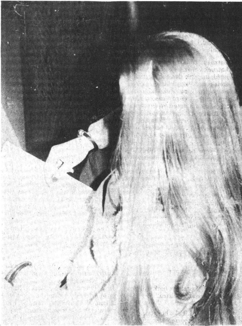
...noski, garesti ateratzen da baina gure etxean kliente onak ditugu...

ezagutzen dituzu... Gero lagun batek esan zidan toki hau nola toki ona zen, hemen dagoen onena, ez diruagatik, nik gehiago irabaztea ere baneukan, baizik eta lana egiteko moduagatik.