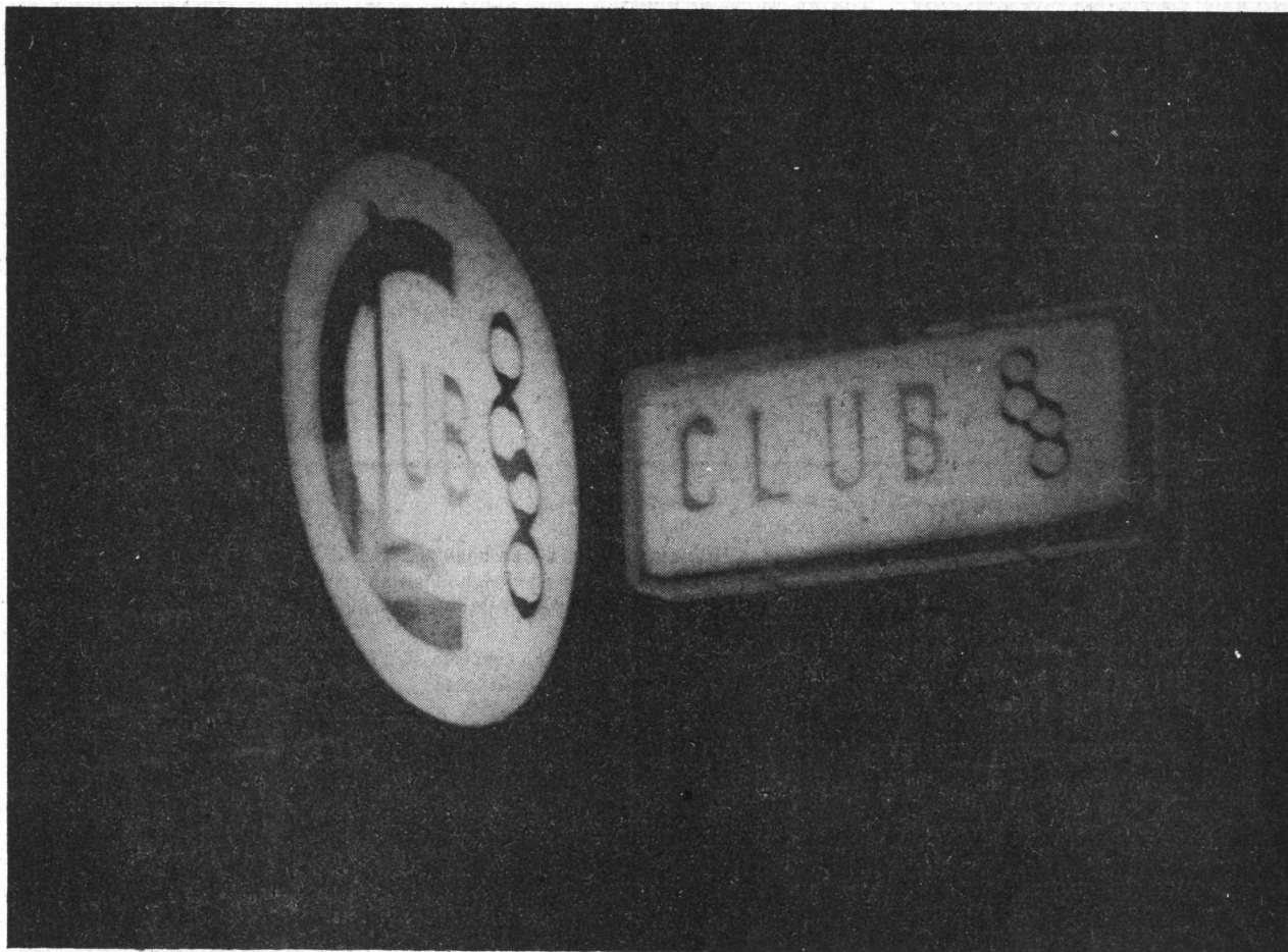
Gehienetan afaltzera gonbidatzen gaituzte...